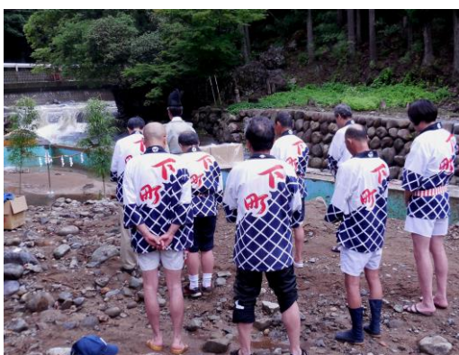
6月30日、小野川にて行われた2番山豆田下町のお汐井採り行事