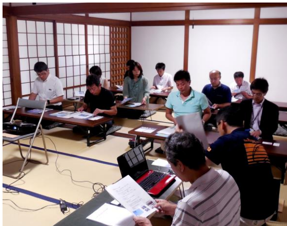
杵築市で町づくりに励む協議会の皆さん

「豆田では空き地・空き家対策はどうなっているのか」などの質問が出されていました。