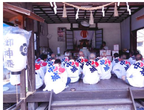
7月1日中城御旅所で行われた三番山中城町の神事