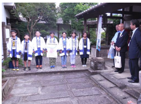
子供ガイドの説明に聞き入る参加者

翌日は豆田町の現地研修が行われ、参加者は草野本家の修理現場や子供ガイドが説明する廣瀬資料館や桂林荘公園や長福寺などを見て回りました。更に午後には伝建地区内での後継者問題や町並みの活性化問題についての分科会が開催されました。