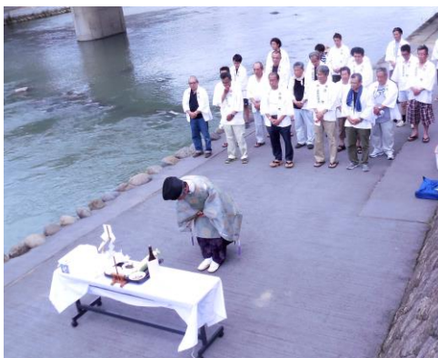
7月1日に行われた一番山港町の花月川での棒鼻清め神事

七月一日には港町・中城町でそれぞれ神事が行われ、豆田四町で一斉に小屋入り行事を行って、今年の祇園祭の成功を祈念しました。