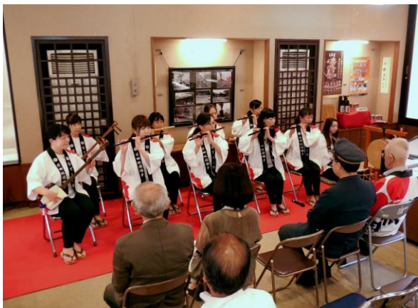
開会イベントで披露されたなでしこ会の演奏

この特別展は九月二日まで開催予定であり、観光協会では地元の方にも是非見ていただきたいと呼びかけています。