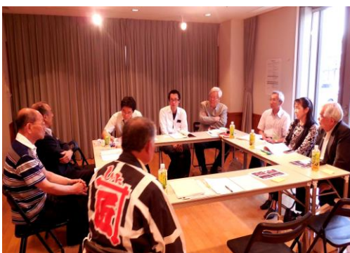
伝建地区の課題を論議した分科会