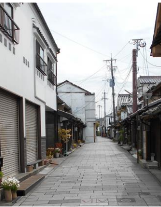
人通りも無く、休業の店舗が目立つ魚町通り