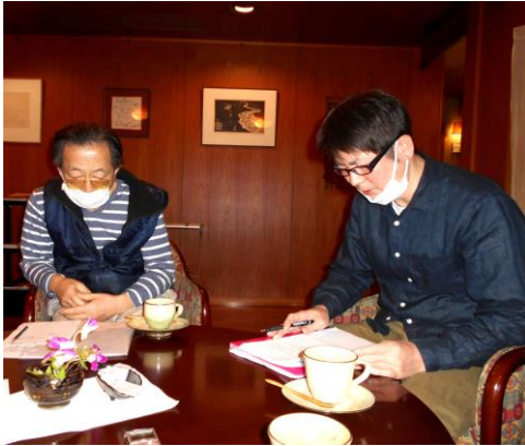
高倉会長（左）待鳥会長（右）