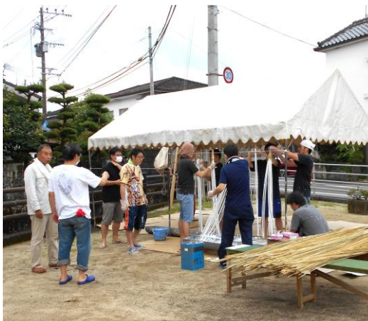
パイパイ塗りの作業を行う中城町

その結果①七月二十五日（土）豆田八阪神社で行われる神事に参加する。②魔除けで作成されるパイパイは本年も作成し、関係者や協力者に配布する。③当番町（一番山）となっている中城町は次年度も当番町として役割を果たす。以上の事が確認されました。