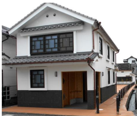
上町の町並と一体感が保たれる様整備された居蔵造りの公衆トイレ

なお、祇園祭時には広場に山鉾収納テントを設置し、住吉通りから山鉾が入りやすくなる予定です。