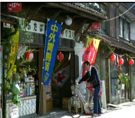
寅さん映画で薬局に変身した高瀬家