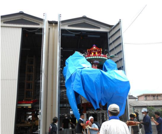
上町、下町の山鉾が収納された収納庫

両山鉾振興会では、今までの倉庫やテントでの保管は吹き曝しの状態にあり、「良好な保管環境が確保出来る」と安どしています。