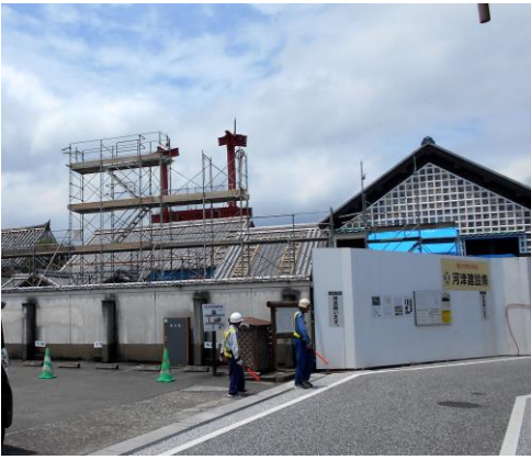
建物が見える様になった草野家住宅

なお、道路と建物を隔てる工事壁はしばらくは維持される事となり、工事関係者は「交通上ご不便等をおかけしており、今しばらくの間、御理解、御協力の程よろしくお願いいたします。」と呼び掛けています。