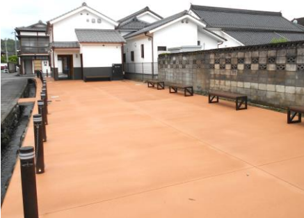
祇園祭には、山鉾収納テントも設置される広場