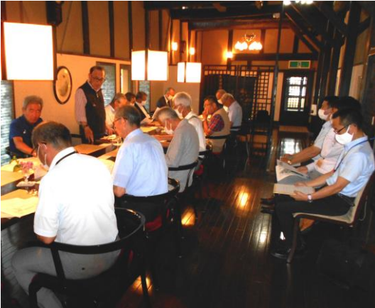
本年度の事業計画を協議した総会

また、小学生対象の「作文コンクール」の実施については教育委員会より咸宜小と桂林小に協力要請を行っている事が報告され、振興協議会としても出来得る限りの協力を行って行く事が確認されました。