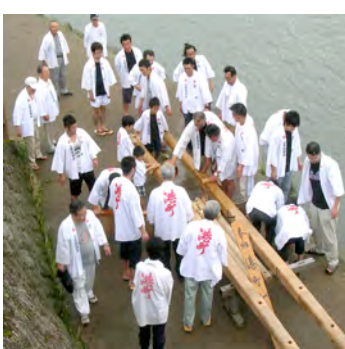
花月川の清流で、みそぎの棒鼻洗いを行なう港町山鉾