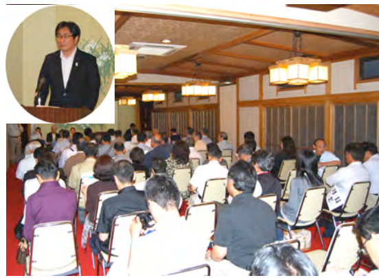
議論重ねた総会、左上は挨拶する原田市長

最後に役員改選が行なわれ、執行部より提案された人事案が採決の結果承認されました。（選任された役員は以下の通り）