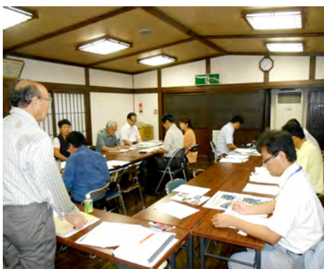
本年度の基本方針を話合った実行委員会

委員会では、昨年の花月川でのまつり会場が仮復旧だった事から本年度のまつり会場の整備状況の確認・あかりオブジェの一般公募・本年度の竹伐採箇所の確定などが協議されました。