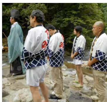
小野川上流のお汐井採り行事から祇園行事を始める下町山鉾