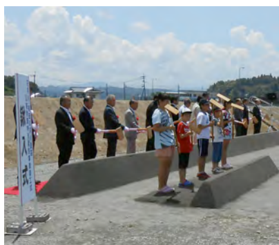
子供達も参加。清水町坂本橋上流で行なわれた「鍬入式」

日時 7月27日(土) 17時~21時 場所 上城内町 八阪神社境内 ※屋台村 (壮年会・料理教室) ※厄除けパイパイ・あやめ販売 ※元方の茶菓子・お神酒の接待