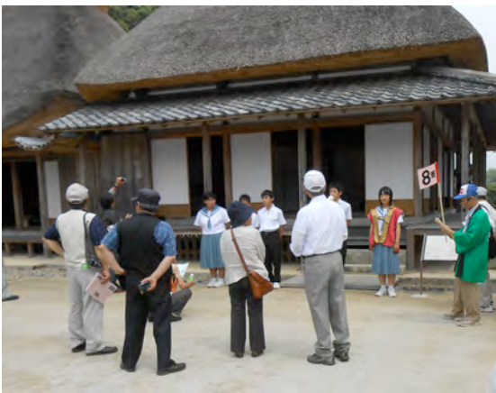
寄贈を受け、市が茅葺屋根等の整備を行なった旧増田家住宅を説明する中学生

豆田町も豆田まちづくり交流館（仮称）の整備課題を抱えており、熱心な議論が行なわれました