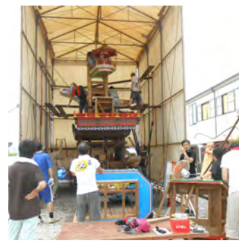
平成2年より曳廻した山鉾の最後の組立てを行なう上町山鉾