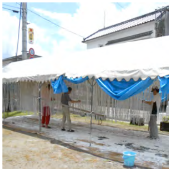
山鉾を飾る「パイパイ」の白ぬり作業を行なう中城町山鉾