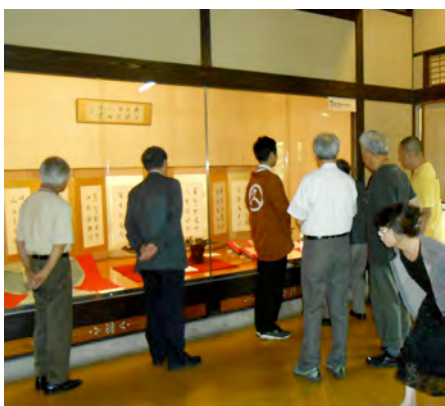
特別展の展示品に見入る参列者