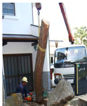
チェーンソーによって切り倒された松

旧船津歯科玄関横にあった伝建の環境物件指定の松が枯れ、通行に危険な為、九月末に除去されました。