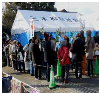
三本松本通商店街の 恵比須祭りの様子

又丸山町の財津家前の恵比須様でも家内安全を祈願して神事が行なわれ、町内有志の方が参拝を行なっていました。