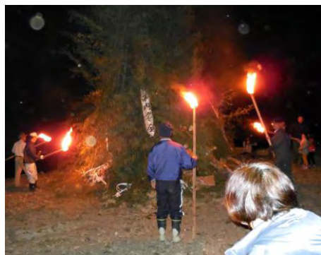
朝取ってきた青竹に松明で火を 点ける年男・年女の皆さん

花月川河川敷に設けた竹のヤグラに年男・年女が火を点け、今年一年の無病息災を願っていました。