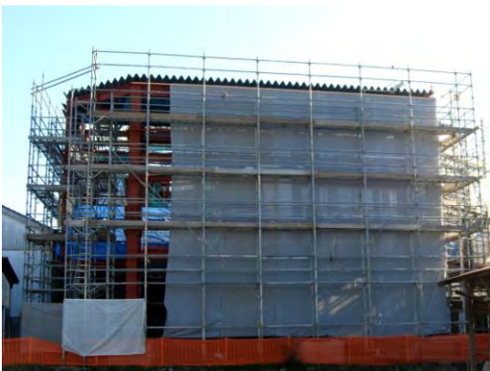
「工事用覆い」に覆われた草野本家の蔵。35cm角の太い鉄骨が見える

この工事の設計監理は国の重要文化財の修理を数多く手掛けている（公益財団）文化財建造物保存技術協会（略称：文建協）が行っており、「文建協の指導の下、解体時には瓦一枚、板一枚に番号を付け、壁土も復元の際再利用するので、きちんと保存しなければならぬので大変です」「また工事用覆いは地下の遺構を傷つけない為と耐震性を確保する為に、大きなコンクリートブロックと鉄骨構造を持つものになっていきます。今後は主屋の方も同様の工事用覆いが設置される事になり、しばらくはランドマークのなまこ壁が見られなくなります。が、ご理解頂きたい」と話されました。