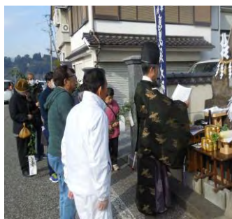
神官の祝詞に家内安全 を祈る丸山町の皆さん

又丸山町の財津家前の恵比須様でも家内安全を祈願して神事が行なわれ、町内有志の方が参拝を行なっていました。