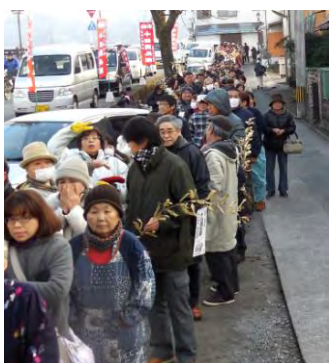
道路まであふれた参列者の列 豆田八阪神社境内にて

また三本松本通商店街でも千二百本の福笹が用意され、福笹一本(二百円)買う毎の二枚の抽選券が付いてくる福引きに長蛇の列が出来、干支の置物や清酒などが当たる度に威勢の良い鉦が鳴っていました。